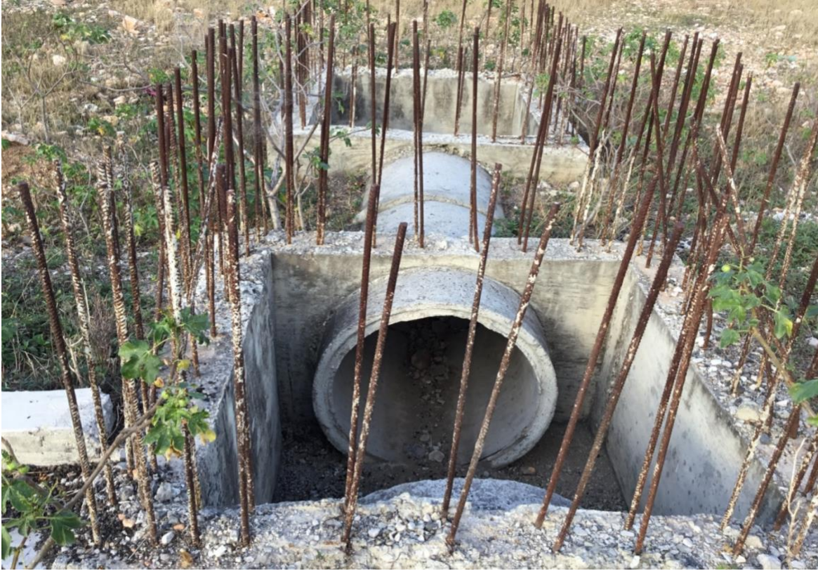
Drainage et voirie

328 En définitive, la Cour constate que les travaux de construction du marché public et de la gare routière de Miragoane ont été abandonnés. Les responsables du MPCE n'ont pas précisé les motifs de cet échec et pourtant, la population attend l'ouvrage avec impatience.