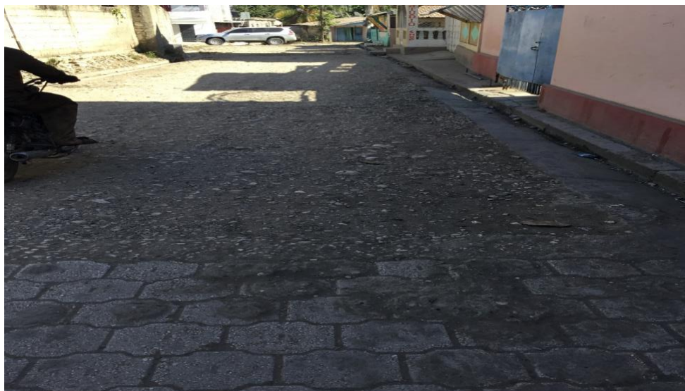
Rue Dessalines près de 200m non adoquiné.

308 En définitive, la Cour constate que les rues ne sont pas terminées. En effet, les axes perpendiculaires entre la rue Pétiou et la rue rivage de la rue Véronique 1 à la rue Véronique 6 sont en terre battue et ne contiennent pas de drainage et de dalot. Il faut préciser que la rue rivage est totalement en terre battue et sans caniveau. La Cour conclut que le projet est inachevé.