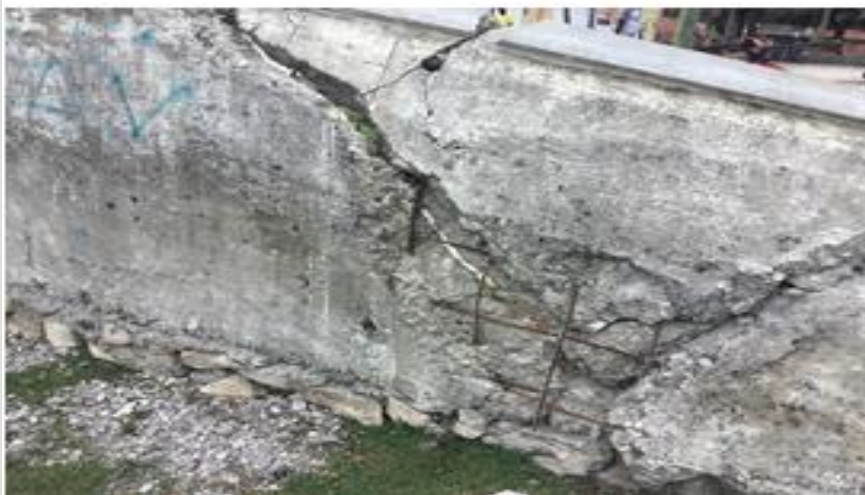
Photos 4, 5 et 6 : Mur de protection en ruine qui na pas résisté à la tornade