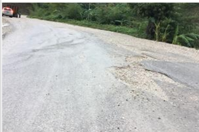
Photos 4, 5, et 6 : Voie en attente des couches d'asphaltage, stabilisation de la route et du canal d'évacuation des eaux et déficiences à reprendre