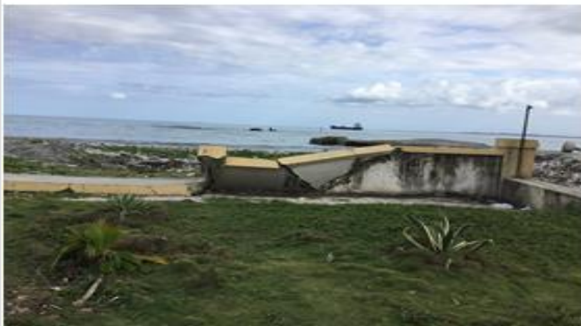
Photos 1, 2 et 3 : Le quai (la jetée), un bâtiment de services et le mur de protection en ruine