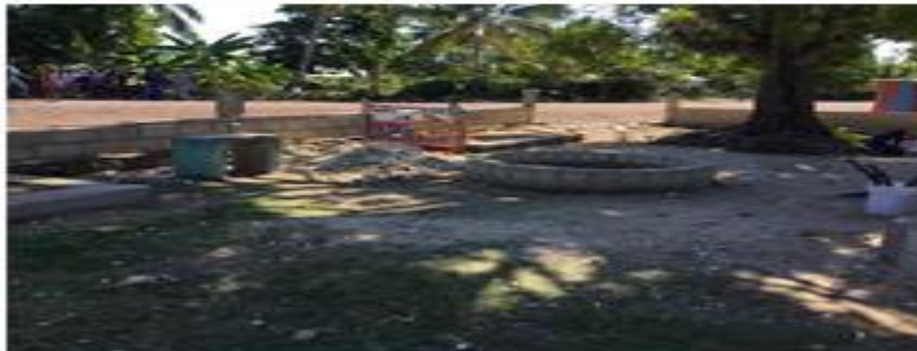
Photos 6,7, 8 et 9 : Places publiques à l'abandon et non fonctionnelles