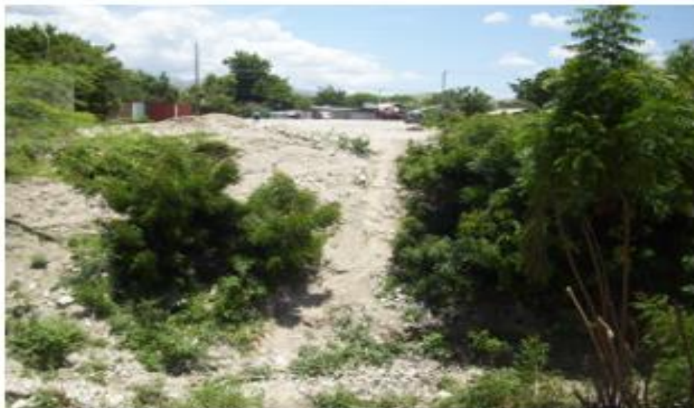
Existence d'un fossé séparant la route de contournement de la ville des Gonaïves à la Route Nationale # 1 |

199 La fiche suivante présente nos principales constatations par rapport à ce projet