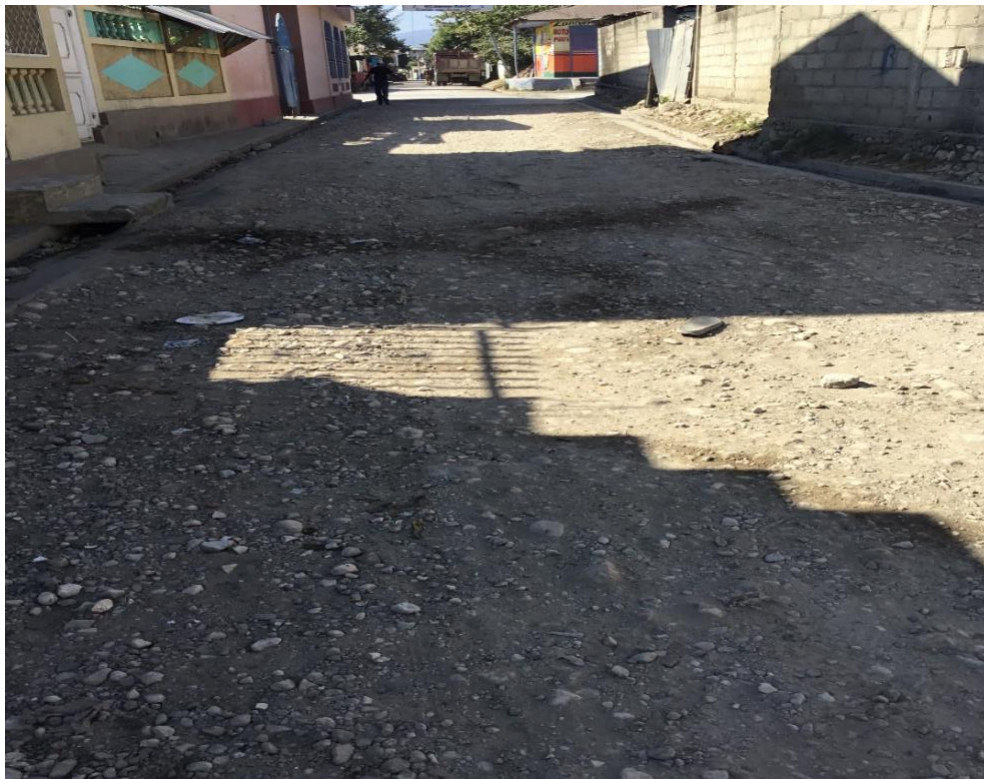
Caniveau les 2 bords de la rue, rue Paul E Magloire, près de 100m non adoquiné

307 L'équipe technique de la Cour a effectué une visite sur le terrain dans le cadre de ce projet. Les documents techniques (Plans et relevés topographiques) fournis par le MPCE ne permettent pas de faire la démarcation entre les travaux qui devraient être réalisés à partir du Contrat de chacune des phases (I & II). Cependant, la visite des lieux montre que les travaux de drainage des rues Véronique 1 à Véronique 6, toutes perpendiculaires à la rue Rivage (zone hôtel Maguana), n'ont pas été exécutés. De plus, les rues 10A, B1 à B6 ne sont pas identifiées par la Cour.