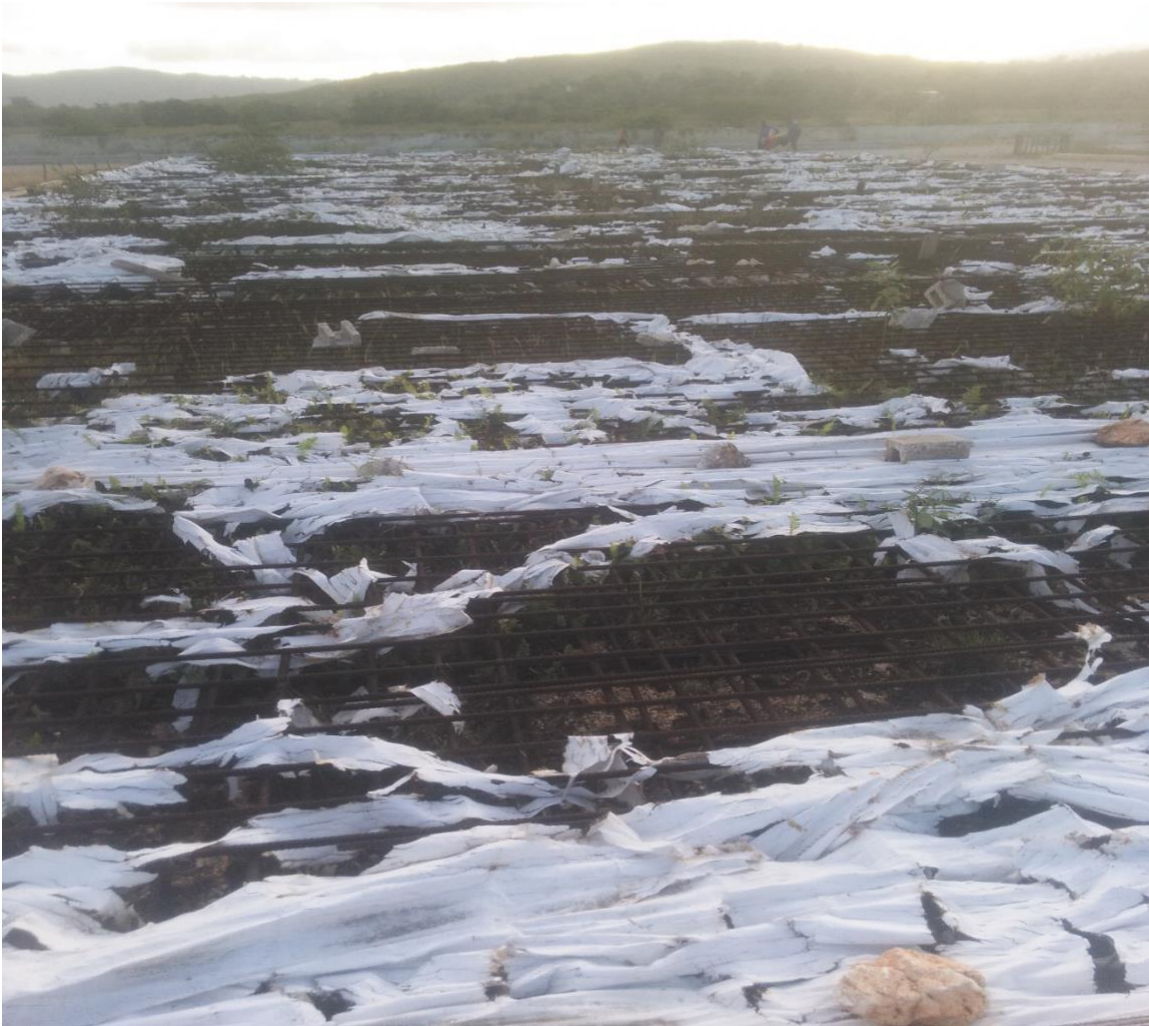
Socle pour l'installation du marché inachevé

voirie. Toutefois, certains socles ont été préparés pour la construction du marché et d'autres restent au stade de fondation. Il faut signaler que le dernier versement a eu lieu en février 2016. Durant cette période, les travaux ont atteint un degré d'avancement de 35,27% suivant l'évaluation comparative du Groupe Trame, la firme de supervision.