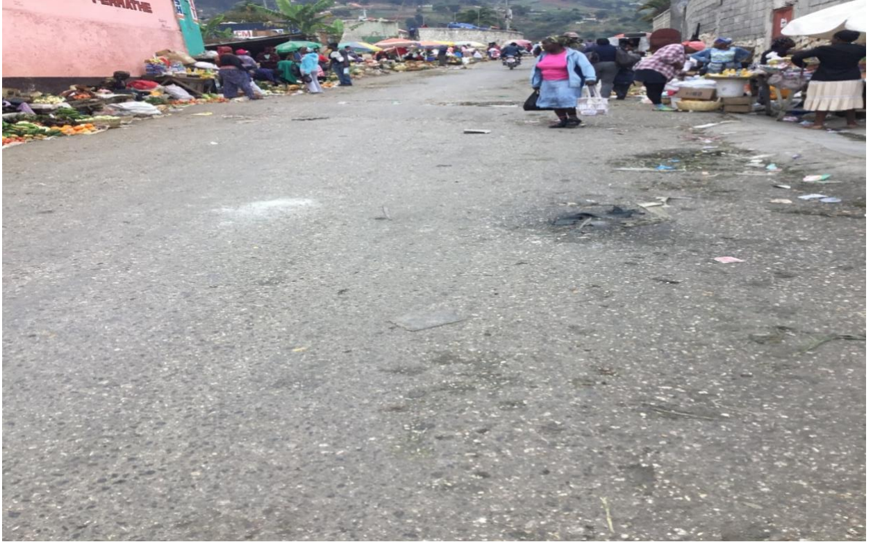
Chaussées dégradée ayant des cuvettes